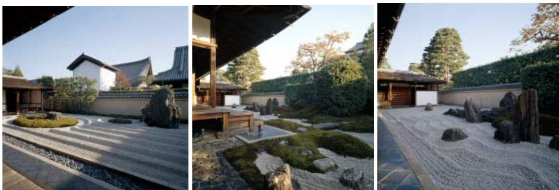
Japansk have

Identitet siges at være noget der forbliver det samme over tid. Da alt forandrer sig, kan det synes umuligt at tale om identitet. Identitet er imidlertid ikke noget vi har. Den skal skabes, vedligeholdes, udvikles og dyrkes. Identitet forstået som noget der til en vis grad har været og bliver ved med at være det samme, må i Danmark være et vejrlig; årstider, tusmørke og lyse nætter, regn, tåge, dugfald, sne, blæst, en temperatur der er egnet til arbejde og betingelser, der gør at jorden kan dyrkes.