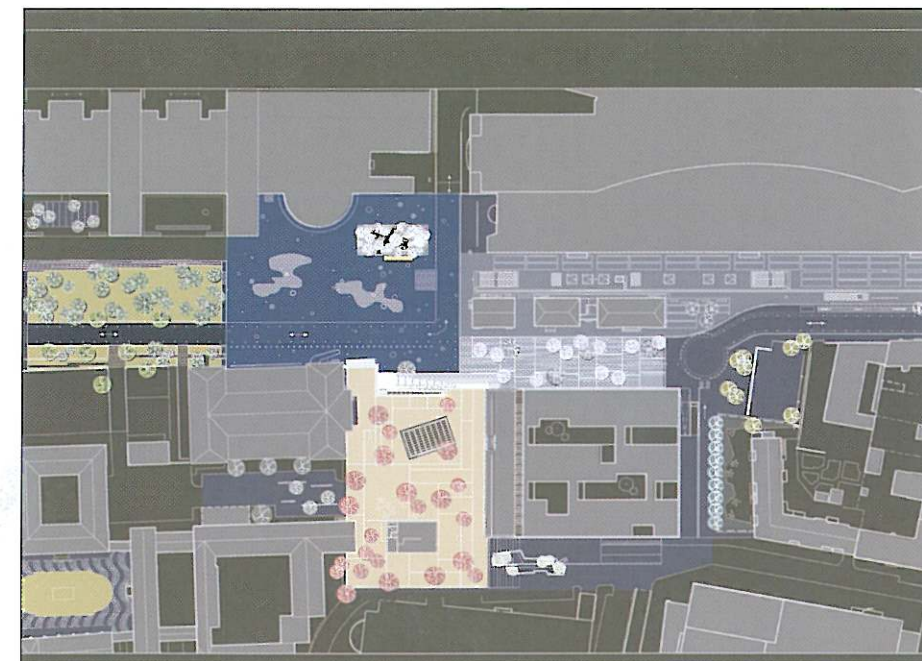
Frederiksberg Nye Bymidte. Projektforslag. Etape 1,2,3 og 4.

I stedet for at haste til de indendørs gader, skal Frederiksberg-borgerne kunne benytte deres nye bymidte som en fælles dagligstue. Derfor er traditionelle overflader som asfalt og betonfliser i stor udstrækning enten erstattet af mere imødekomende og spændende materialer eller behandlet, så de pirrer vores sanser fremfor at sløve dem.