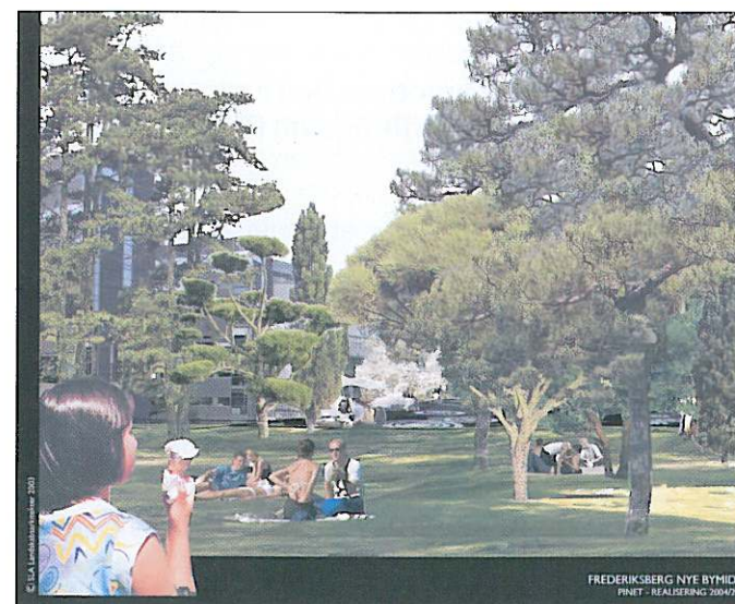
Frederiksberg Nye Bymidte. Pinet. Realisering 2004/2005.

Ikke bare for at mærke, hvad omsorgsfulde og komfortable omgivelser gør ved én. Men også fordi der ikke er så mange andre byer, der på tilsvarende måde har taget hånd om sine byrum – i Danmark.