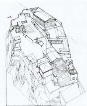
Akropolis. Prikket linje indikerer veien gjennom Propyleene til Parthenons østfasade.

EDMUND HUSSERL (1859–1938) Tysk filosof. Han viser seg på som grunnleggeren av fenomenologien. Han utvikler et begrep for den transcendentale fenomenologi. Opererer med et rombegrep knyttet til menneskets væren i verdensrommet, med fokus på intersubjektive opplevelser som utgangspunkt for objekter.