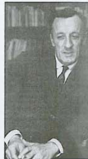
MENNET PÅ BAKEN TILTALTE: MERLEAU-PONTY, EDWARDS LIGNER, 1948-1950.

«Jeg iagttager en ubevægelig sovende mand, som pludselig vågner. Han åpner øynene og rækker ud efter sin hat, der er faldet ned ved siden af ham, og tager den på for at beskytte sig mod solens lys. Det, som endeligt overbeviser mig om, at min sol også er hans, at han ser den og mærker den, ligesom jeg gør, og at vi virkelig er to, der perciperer verden, er netop det samme, som først forhindrer mig i at tænke den anden: nemlig at hans krop udgør en af mine genstande, at den er en af dem og optræder i min verden.» (Maurice Merleau-Ponty,