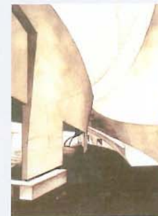
Steven Holl: Skisse til Kiasma, Helsinki.

Det gjør Holl derimot på andre og mer subtile måter i den samme bygningen. Romlige forløp hvor blikket alltid aner en fortsettelse rundt om hjørnet, setter kroppen i bevegelse. Skift i skala, lys, farge, lyd mm. setter i gang en kroppslig interaksjon med rommene. Nettopp denne skjerpningen av overgangene, hvor sanseapparatet må settes i gang, kjennetegner Holls romdisposisjon. Dette er ikke noe som Kiasma er alene om; det kjennetegner all engasjerende arkitektur, landskapsarkitektur og planlegging. Noen vil kanskje spørre om dette er en oppfordring til en patetisk – i betydningen overspilt – holdning. Men det som skjer, er at oppmerksomheten rettes mot selve kroppsopplevelsen, og ikke på hvilke effekter som setter den i gang.